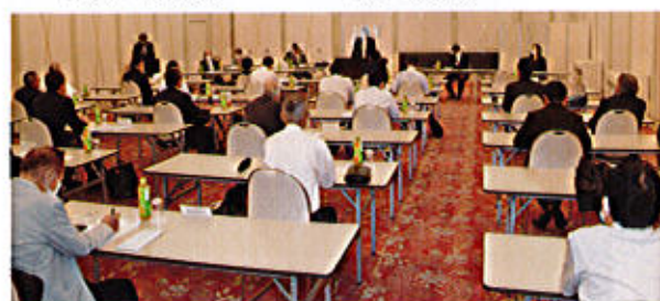
ホテルルプラ王山 2F 白帝の間