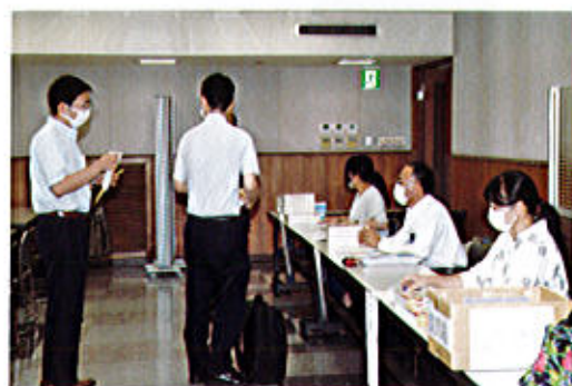
受付 昭和ビル9Fホール