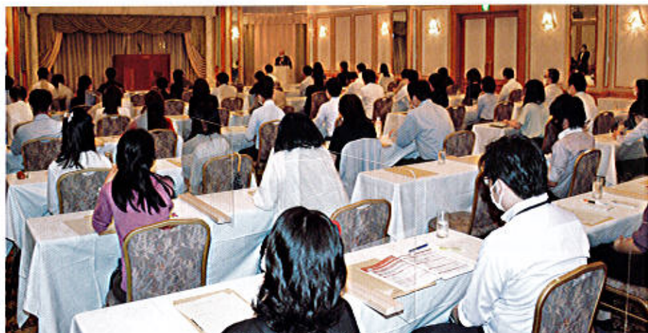
東京第一ホテル錦 2F プリランテ