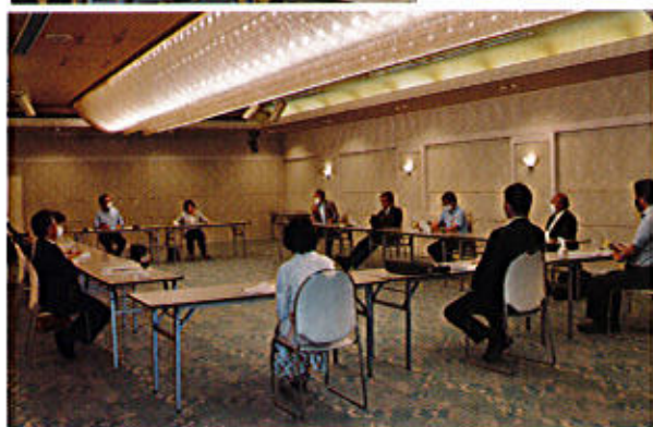
ホテルルプラ王山 2F 葵の間