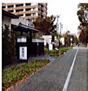
ナゴヤ セントラルガーデン レストラン・ショップ