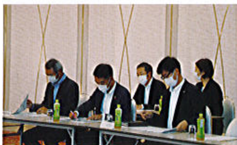
大同生命保険、AIG 損害保険、アフラック