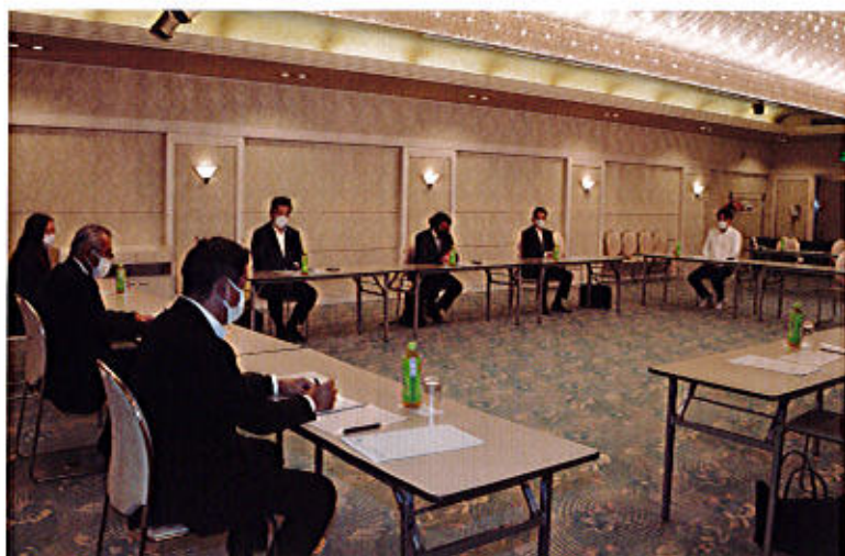
ホテルプラ王山2F 葵の間