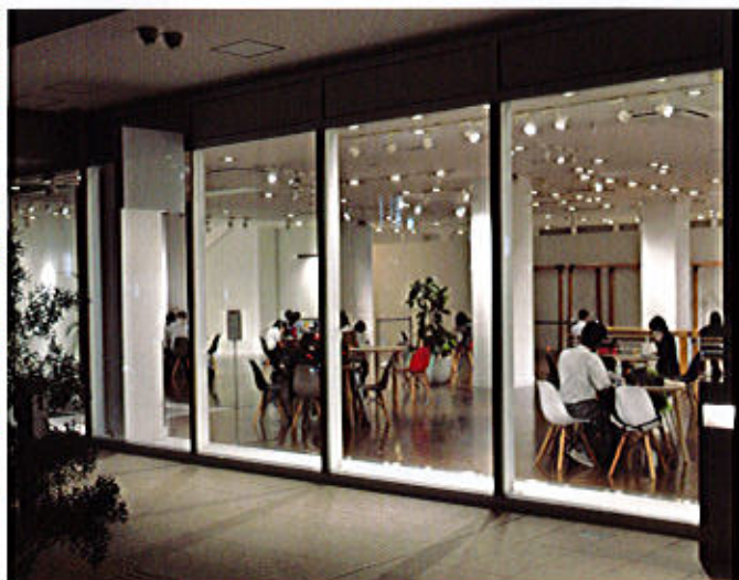
星が丘テラスレストハウス夜景