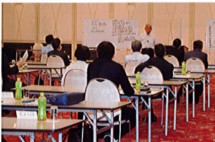
ホテルルプラ王山 2F 飛翔の間