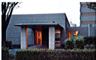
セントラルガーデンレジデンス

道から始まる二つの新しい街を散歩しました。一つは星ヶ丘元町の「星が丘テラス」です。ここは建物が道をはさんだ形になっていて、東側の建物は「East」、西側の建物は「West」と名付けられています。