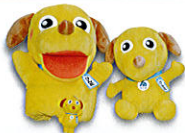
法人会マスコット「けんたくん」

全国法人会総連合では、法人会のマスコットである「けんた」のぬいぐるみ等を制作しました。法人会のメイン活動の一つである「社会貢献」の「献」=「ケン」=「犬」と結び付くことから、親しみやすいキャラクターとしたものです。左からバベット(高さ約26cm 素材ポリエステル、綿等 価格 税込1,100円)、手前のスクイーズ(高さ約7cm 素材ポリウレタン等 価格 税込220円)、ぬいぐるみ(高さ約19cm 素材ポリエステル、綿等 価格 税込935円)