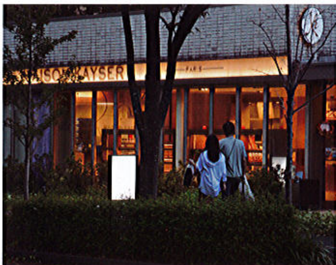
ナゴヤ セントラルガーデン夜景