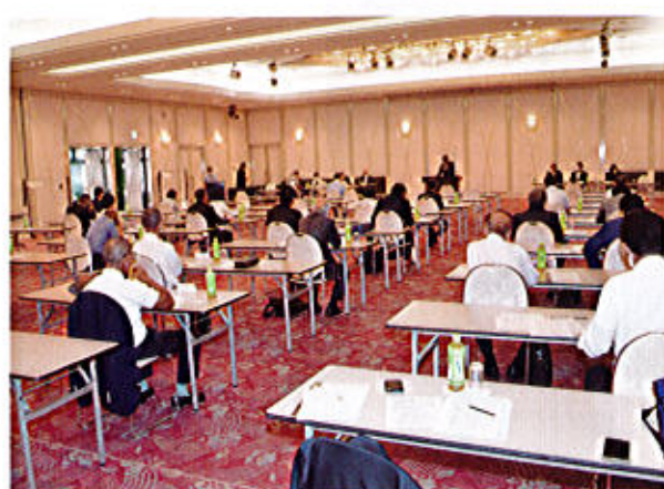
ホテルルプラ王山 2F 飛翔の間