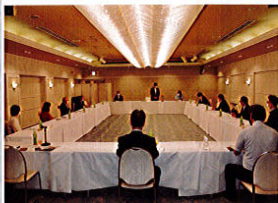
ホテルプラ王山2F 葵の間