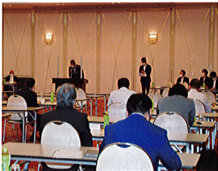
ホテルルプラ王山 2F 飛翔の間