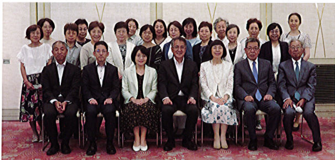
ホテルプラ王山2F 白帝の間